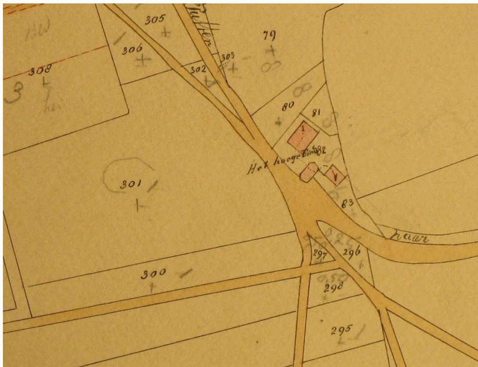
Figuur 2 Het Hoge Eind op de kadasterkaart van Halvinkhuizen (1880).