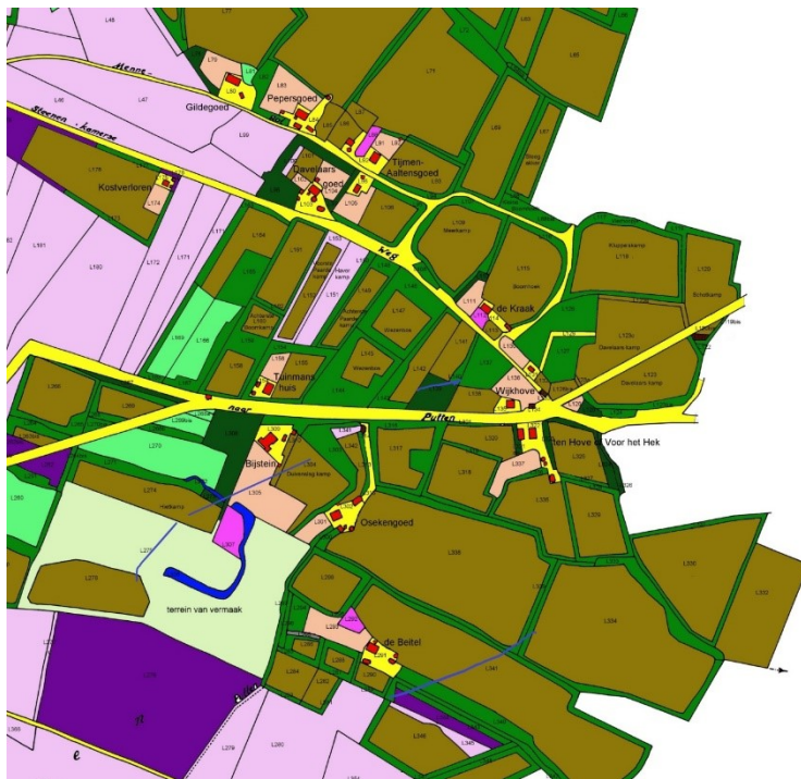
Figuur 1. Detail van ingekleurde kadastrale kaart Beisteren 1832 met het goed de Beitel.

Zoals elke oude boerderij in Bijsteren en Halvinkhuizen had de