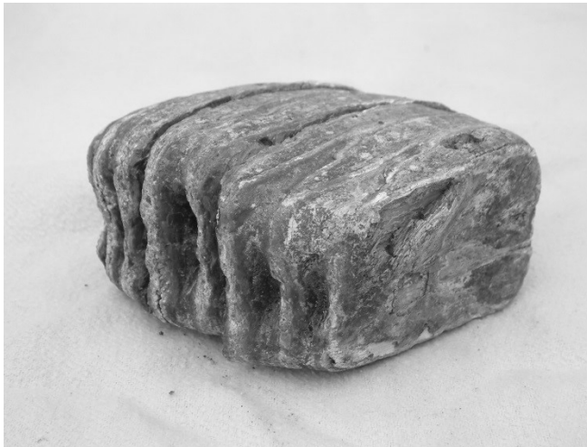
Een grote mammoetkies, gevonden op de Solse Berg te Garderen. De mammoet heeft dus op de Veluwe rond- gezworven en is zo'n 12.000 jaar geleden uitgestorven.