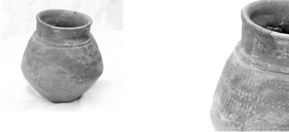
knikpot -- detail pot

lijken nog verbrand maar met de komst van het Christendom werden de doden alleen nog maar begraven.