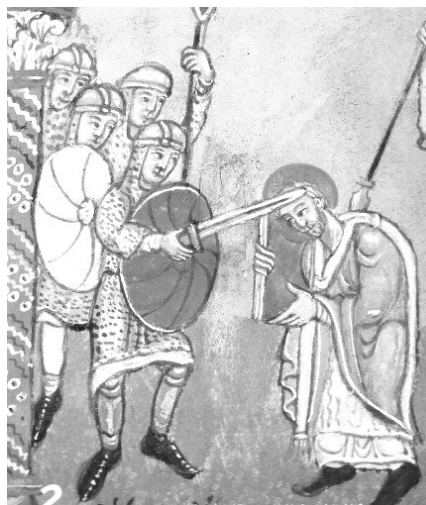
Afbeelding van de moord op Bonifacius

kringvormige omheining besloten. In het laatst van die eeuw, nadat de Merovingische Franken reeds enigen tijd, vooral aan onze groote rivieren, gevestigd hadden, en b.v. aan de Rijnmond en in Utrecht belangrijke nederzettingen hadden doen verrijzen, moet ,althans op deze laatste plaats zeker, ook reeds een niet onaanzienlijk centrum van christelijke eredienst en zending zijn ontstaan.