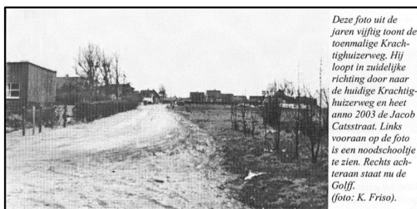
Deze foto uit de jaren vijftig toont de toenmalige Krachtighuizerweg. Hij loopt in zuidelijke richting door naar de huidige Krachtighuizerweg en heet anno 2003 de Jacob Catsstraat. Links vooraan op de foto is een noodschooltje te zien. Rechts achteraan staat nu de Golf.

Iedereen op 't Veld had vroeger wel een paar geiten en daarom