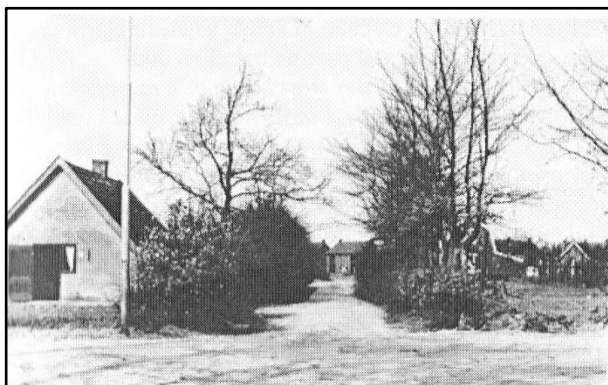
De Peppelerweg in de jaren vijftig, gezien vanaf de Calcariaweg richting het dorp. In het huis links op de foto woonde Cozijnsen, de 'scheresliep'.

schrift Verboden Toegang. Op voorstel van een van de raadsleden wordt besloten het recht om vrij plaggen te steken op donderdagen te handhaven en de bordjes te laten verwijderen.