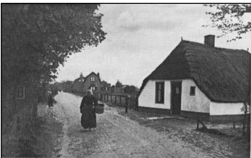
De Garderense weg in de jaren dertig, genomen vanaf de kruising met de Voorthuizerstraat. Rechts van deze weg ligt 't Veld. In het huis dat links schuil gaat achter de boom woonde toen de familie Van de Weitgraven.

Bij die huisjes stonden meestal allerlei hokken en schuren en soms een klein hooi- of strobergje. Een met planken afgezette ruimte waarbinnen varkens liepen, een kippenren, een water-