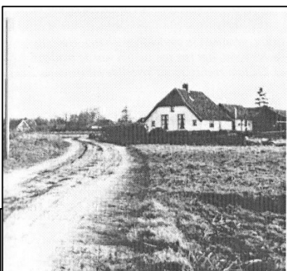
dezelfde plaats ligt nu de Veldstraat. Links achteraan op de foto is het pand van Van Loosenoord te zien.

veld bepalend is geweest bij de keuze van de plaats waar een nederzetting kon worden gesticht. Ook ons dorp kende een broek en een veld. Er was sprake van een Putterbroek en een Putterveld. Het Putterbroek strekte zich westelijk van het dorp uit. De Engersteeg vormde een verbinding tussen de Putterbrink en het Putterbroek. Het Putterbroek lag op vrij grote afstand van de brink.