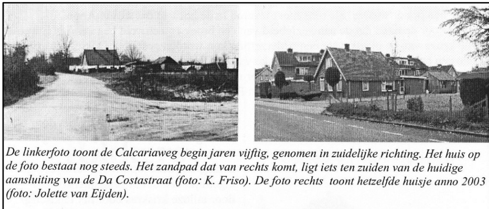
De linkerfoto toont de Calcariaweg begin jaren vijftig, genomen in zuidelijke richting. Het huis op de foto bestaat nog steeds. Het zandpad dat van rechts komt, ligt iets ten zuiden van de huidige aansluiting van de Da Costastraat. De foto rechts toont hetzelfde huisje anno 2003.

Bij de stichting van de woonwijk bleef zo hier en daar zo'n huisje staan. Wie goed oplet kan zo'n huisje nog wel tussen de woonblokken ontdekken. De zandweggetjes Verdwenen, evenals de rogge- en aardappelvelden, die doorsneden werden door scheivoren waarlangs de kinderen vroeger naar school liepen en die vaak in kleine voetpaadjes veranderden.