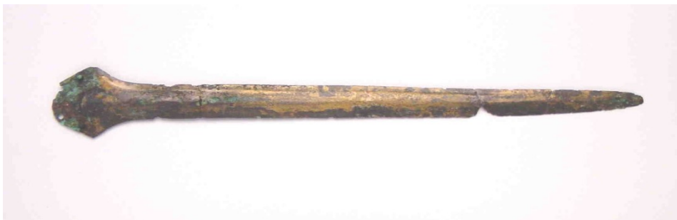
Het bronzen zwaard van Putten, collectie Museum Flehite Amersfoort

De scherven van deze urn zijn lang bewaard gebleven op “Schovenhorst”, maar helaas verloren gegaan. Gelijkzeitig moet ook het bronzen zwaard gevonden zijn, maar een precieze vermelding werd door de heer Schober nooit gedaan (ook niet in het gedenkboek van Schovenhorst). Uit het vervolg blijkt waarom deze vermelding nooit is gedaan.