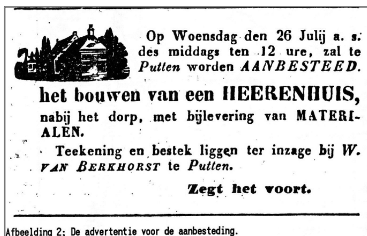
Afbeelding 2; De advertentie voor de aanbesteding.

H.F.Th. Fockens, predikant te Twijzel en Koten in Friesland (1818-1867), die van Pasmaan een stuk grond koopt om daarop het burgemeesters-