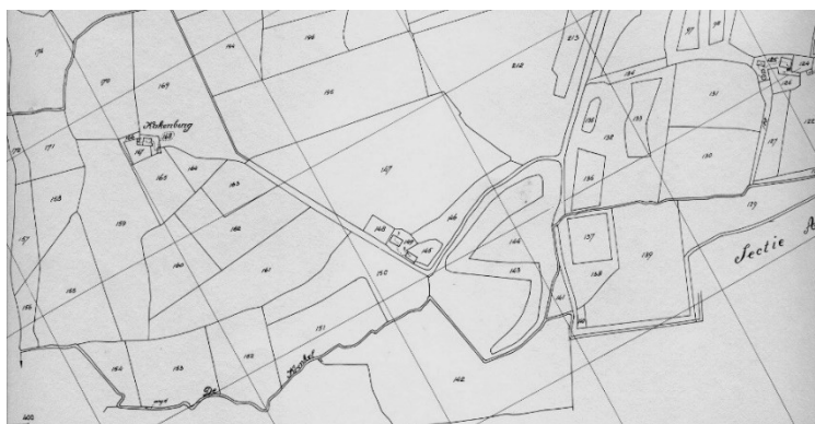
Afb. 2: De kadastrale kaart 1832 laat zien dat de weg naar Krakenburg noordelijk langs het vreemde perceel loopt met in de hoek de boerderij Valkelo.

werkelijkheid berust of een fantasie is van een bewoner van een latere Vanenburg is vooralsnog onbekend. Archeologisch onderzoek zou daar eigenlijk meer duidelijkheid over moeten kunnen verschaffen. Maar dan moet je wel de plaats weten waar dat oude Vanenburg heeft gestaan. En die weten we juist niet. Het is op de topografische kaart van De Man van 1802 en op de kadastrale kaart van 1832 (de oudste bekende betrouwbare kaarten van het gebied) niet aangegeven. Dat op zichzelf kan er op duiden dat het een minder belangrijk 'huys' was. Ook betekent het dat het vóórdat deze kaarten zijn verkend al verdwenen moet zijn. Dat het niet op dezelfde plaats heeft gestaan als de latere Vanenburg is zeker. Immers, nog tot in de achttiende eeuw was er in akten sprake van beide huizen die op korte afstand (een kwartier gaans) van elkaar stonden. Die akten bevatten echter ook enkele aanwijzingen die het zoekgebied kunnen verkleinen. We bekijken ze daarom even wat nauwkeuriger.