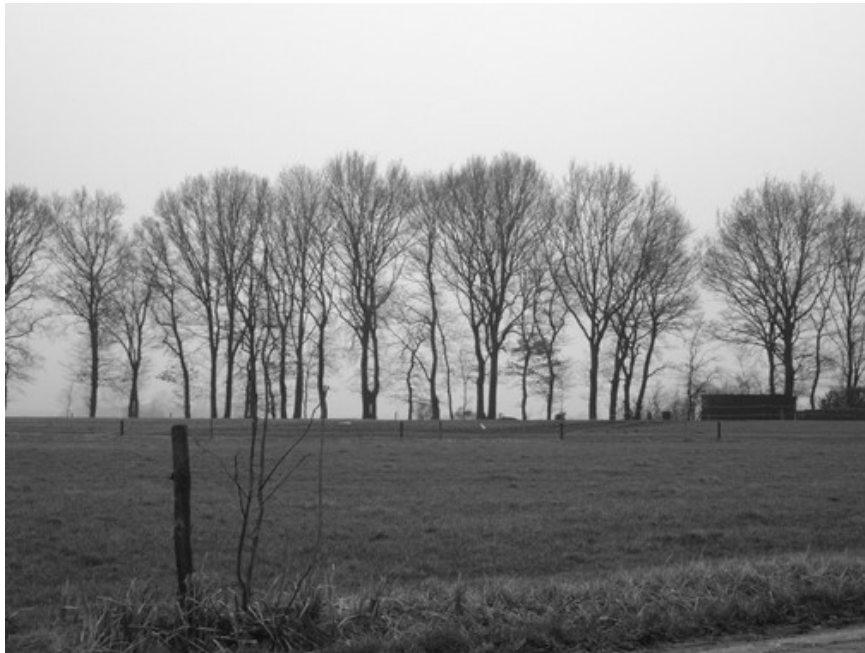
afb.5 Deze foto toont de plaats waar de oude Vanenburg mogelijk heeft gestaan. De omwalling is op de achtergrond nog duidelijk zichtbaar

vroegere weggetje naar Krakenburg (in de huidige situatie loopt het weggetje vanaf Krakenburg rechtdoor naar de Waterweg en scheidt daarbij het vreemde perceel van het stuk land waarop nog een eeuw geleden het Duivelsbos lag, zie afb. 4). Dit perceel is oneffen maar wordt gedeeltelijk duidelijk omwald. Hoewel de wal midden vorige eeuw grotendeels is afgegraven is deze ook op de moderne kaart en op afb. 4 en 5 nog goed te zien.