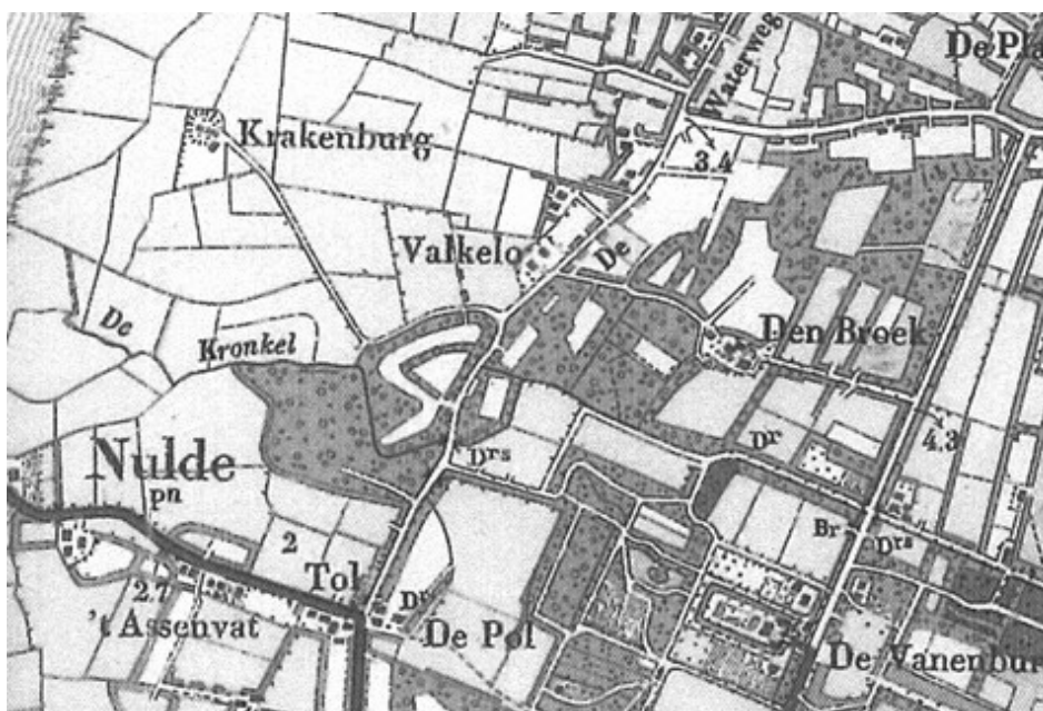
Afb. 3: De militaire kaart van 1906 laat zien dat Valkelo al is verplaatst. Duidelijk is het Duivelsbos aan de zuidkant van het vreemde perceel zichtbaar.

Daarmee is ook de noordgrens van ons zoekgebied bepaald. Immers, dit weggetje is de 'stege' die vanaf de Waterweg (vroeger de Harderwijkerwech) langs Valkelo loopt tot aan het huis en goed van de kinderen van Evert Janssen (hoogstwaarschijnlijk Krakenburg). Al vóór 1906 is Valkelo verplaatst naar de Waterweg (afb. 3). De oostgrens is de voormalige 'Harderwijkerwech' (nu Waterweg) en de zuidgrens de 'Nulderstege', nu de 't Oeverstraat.