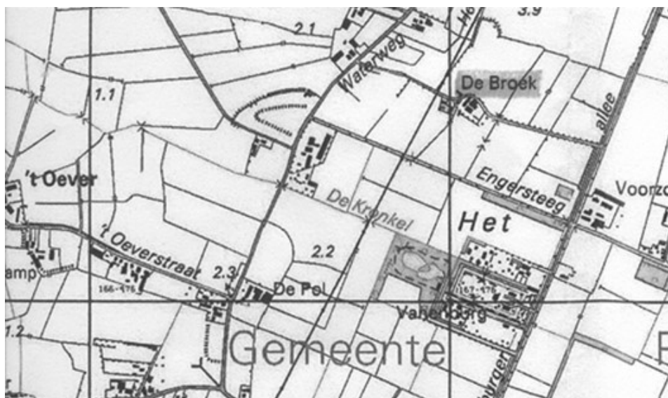
Afb. 4: de moderne topografische kaart toont de huidige situatie. De weg naar Krakenburg is verlegd en het Duivelsbos is verdwenen. Het huidige tracé van de Engersteeg loopt recht naar het omwalde perceel.

Het oude Vanenburg zou een kwartier gaans ten westen van het huidige Vanenburg hebben gelegen. Nu is ‘ten westen van’ een nogal vaag begrip. In ieder geval betekent het dat het ongeveer een kilometer westelijk van de huidige Vanenburg zal hebben gelegen.