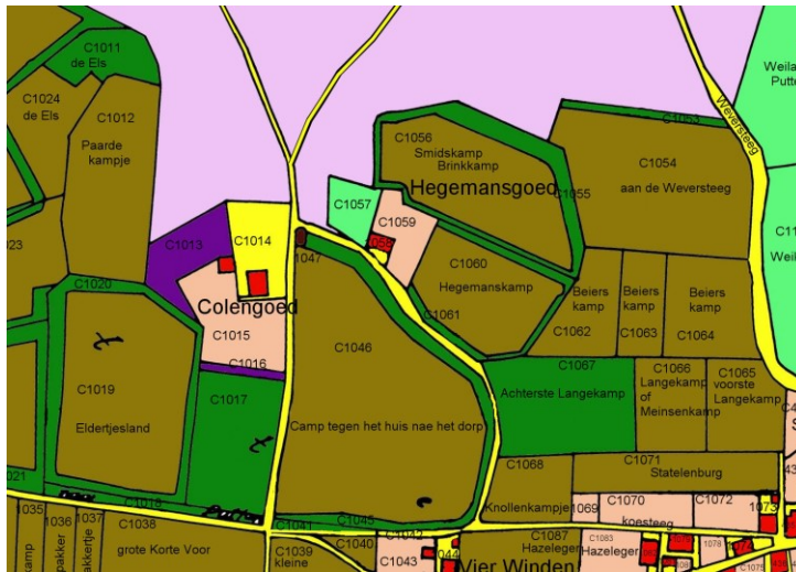
Fig. 2 De kadastrale kaart uit 1832 met Hegemansgoed aan de Putterbrink en omgeving. De namen komen uit eigen onderzoek. Bouwland heb ik bruingekleurd, hakhout groen, weiland lichtgroen en tuinen zalmkleurig. De Dorpstraat is nog net rechtsonder te zien. De beetje schuin lopende weg linksonder is de Stationsstraat, via de Koesteege komt hij uit op de Dorpstraat. Deze verbinding bestaat niet meer. De in 1936 aangelegde Rijksweg doorkruist nu het gebied vlak onder Hegemansgoed en Schoutmansgoed langs. In figuur 3 is dat duidelijk zichtbaar. Zie voor dit soort kaarten voor geheel Putten mijn website: https://historieputten.vandekraats.com/

De Dorpstraat is nog net rechtsonder te zien. De beetje schuin lopende weg linksonder is de Stationsstraat, via de Koesteege komt hij uit op de Dorpstraat. Deze verbinding bestaat niet meer. De in 1936 aangelegde Rijksweg doorkruist nu het gebied vlak onder Hegemansgoed en Schoutmansgoed langs. In figuur 3 is dat duidelijk zichtbaar. Zie voor dit soort kaarten voor geheel Putten mijn website: https://historieputten.vandekraats.com/