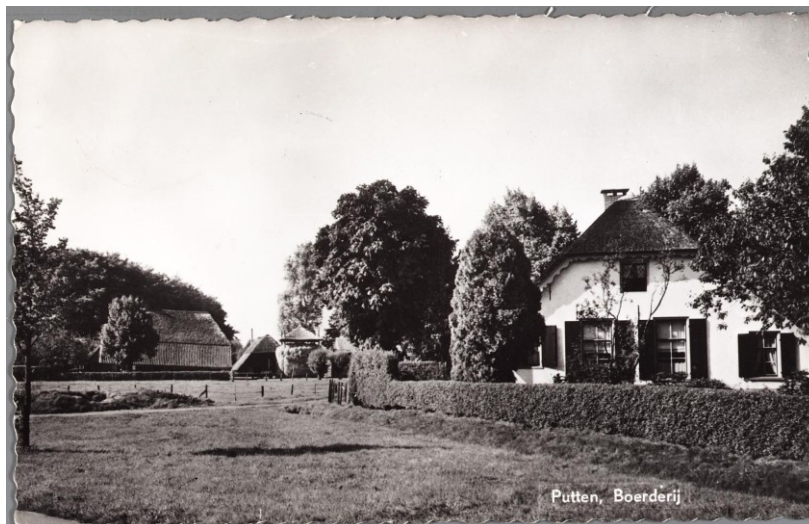
Fig. 4 Ansicht- kaart van boerderij de Putterbrink zoals we hem nu nog duidelijk herkennen. De eigen- lijke maar inmiddels vergeten

van Zoeren (of Soeren). Hij had het kunnen kopen uit de boedel van de Kelnarij goederen. Bij de verdeling in 1841 droeg het de algemene naam Brinkskamp, maar in de volksmond heette het de Smitskamp naar het beroep van Van Zoeren. Een beetje verwarrend is dat wel want ook het perceel C1023 achter het Paardekampje aan de Putterbrink heet de Smitskamp. In 1868 koopt Muin van Dam beide helften en is Hegemansgoed weer compleet. Het is zelfs een nog steeds bestaand en bij de meeste Puttenaren welbekend boerderijtje. Het is toepasselijk gelegen aan, inderdaad, de Putterbrink op nummer 2. Een Ansichtkaart in fig. 4 geeft het vroegere beeld gezien vanaf de oude Rijksweg, met op de achtergrond de eveneens bekende boerderij Colengood. Omdat er ook Ansichtkaarten waren waarop stond: boerderij (aan de) Putterbrink, is het later ook wel onder die naam bekend geworden. Als u weer eens langs deze plek rijdt, kunt u vanaf nu denken aan de oude historie die er aan verbonden is.