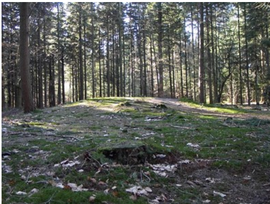
Afb. 2: Grafheuvel 32F-117 (object nr. 44)

Vanaf 5 m noordoostelijk van het monument tot aan de Peppelerweg groeit braam. Acht meter noordwestelijk bevindt zich heuvel 32F-116.