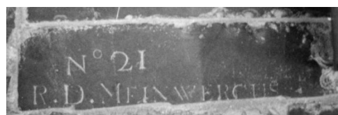
Afb. 4. Een ander stukje grafsteen, eveneens te vinden in de Oude Kerk.

De subkelners worden in dit artikel niet nader genoemd. Toch willen we