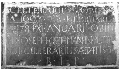
Afb. 3. Een gedeelte van een grafsteen in de Oude Kerk