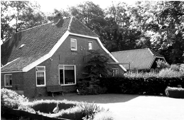
Het ouderlijk huis, Husselsesteeg 17.

Hier in Putten op een boerderij aan de Husselsesteeg nr. 17. De boerderij staat er nog steeds .