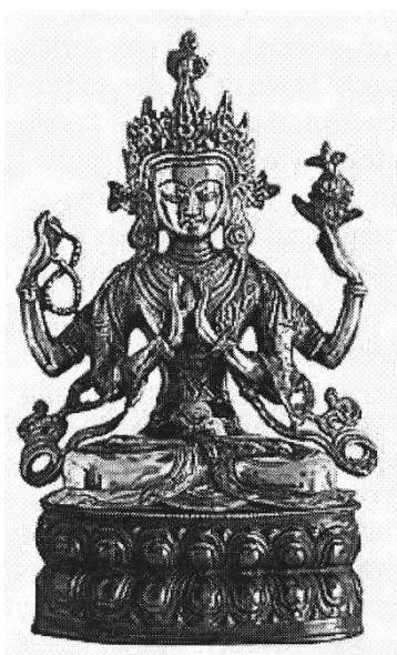
Afbeeldingen: links: Lokeshvara, rechts: Vishnu-Rudra, India (bron: internet). De afbeeldingen van de glas-in-loodramen komen uit het boe/ge Historie van de katho lieke geloofsgemeen schap te Putten van 500 tot heden ' van G. C.J.M Hollanders.

En zo zie je maar weer dichtbij (het historisch ommetje) of veraf: Putten is verbonden met de historie. Mocht u ook zo'n historisch verhaal ontdekken, meldt het ons.