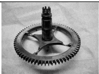
Het pennerad voor reparatie

Nadat alle onderdelen schoon waren werd de klok weer in elkaar gezet en gecontroleerd op slijtage. Diverse onderdelen van het uurwerk waren bijna doorgesleten, o.a. het pennerad. De spaken van het pennerad werden opgevuld met bronzen opvulblokjes en daarna met zilver solder gesoldeerd.