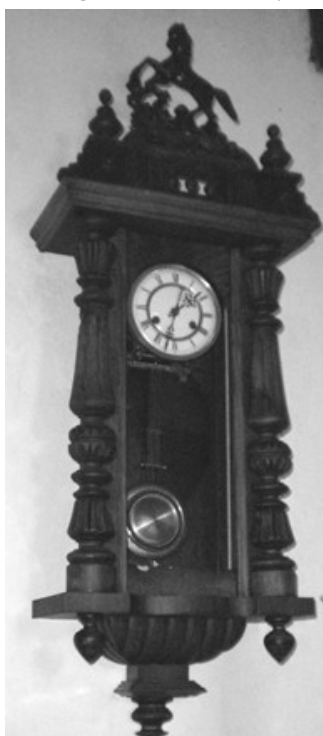
De reguleur (paardjesklok) ziet er weer prachtig uit en geeft de juiste tijd

Deze klok was van binnen en buiten zwart van het roet. Het zat er letterlijk millimeters dik op. In grote lijnen is het onderhoud hetzelfde als van de friese staartklok.