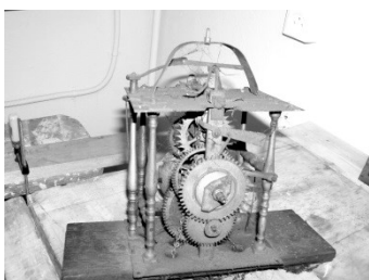
De ver- vuilde klok.

Het uurwerk was sterk vervuild, waarschijnlijk door het gebruik van houtkachels in vroeger tijden.