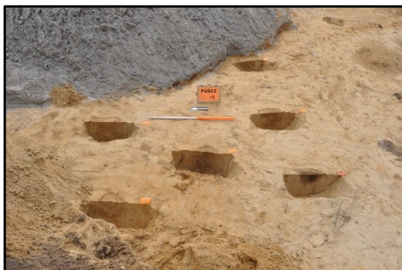
Paalsporen van de ijzertijd-boerderij