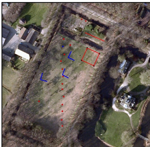
Luchtfoto van het onderzoeksgebied met daarop de verschillende boorlocaties aangegeven. Binnen het rood omliggende vierkant is de concentratie baksteen gevonden.