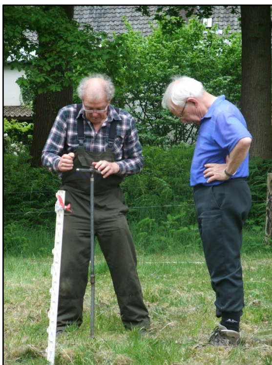
Het oude kasteel wordt haast uit de grond gekeken!

Er is een groot aantal van de verdachte plekken die met wichelroedelopen in beeld waren gekomen, nageboord. Zonder resultaat.