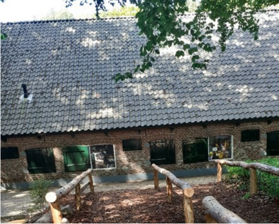
Het resultaat. De foto's voor de platen door Henk van de Zwaag geschoten